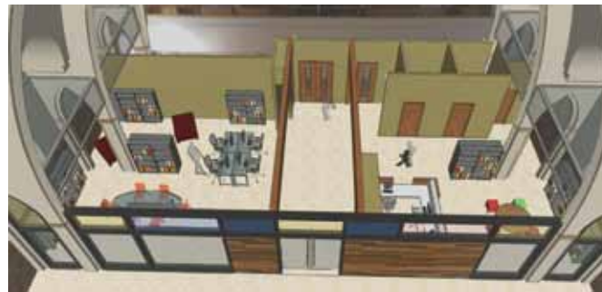
La bibliothèque, vue de la nef.