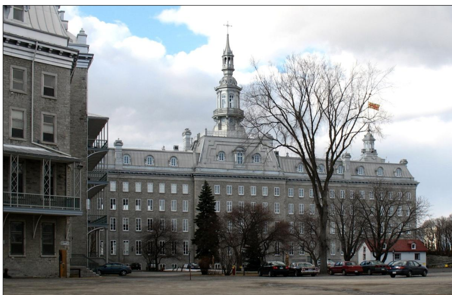
Le Pavillon Camille-Roy du Séminaire de Québec

Dans un premier temps, et c'est sans doute ce qui intéresse le plus l'auditoire ici présent, je présente donc le Centre des archives historiques du diocèse de Québec : brièvement, parce que l'organisation du centre et son aménagement prendront encore une année entière avant de se mettre en place puisque d'importants travaux dans l'ensemble du bâtiment ne permettent pas d'occuper pleinement les locaux qui lui sont réservés; brièvement aussi parce que je veux laisser à l'arrière-plan cette question d'organisation pratique pour mettre en relief les véritables enjeux entourant la création d'un centre d'archives diocésain.